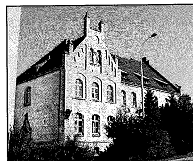
Września: Urząd celny (ob. częściowo mieszkania, częściowo nieużytkowany) fol. S. Mazurkiewicz

Sposób użytkowania: mieszkania, obiekt wystawiony na sprzedaż