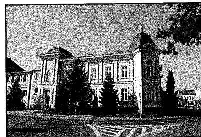
Września: Starostwo powiatowe

Sposób użytkowania: urząd - Starostwo Powiatowe we Wrześni