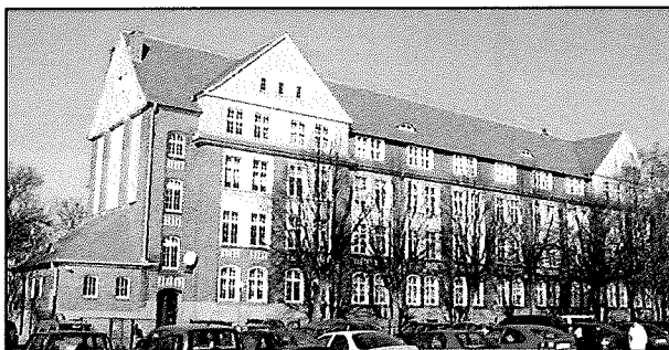
Września: Blok żołnierski w zespole koszar wojskowych (ob. Zespół Szkół Zawodowych nr 2 im. Powstańców Wielkopolskich)

Sposób użytkowania: szkoła - Zespół Szkół Zawodowych nr 2 im. Powstańców Wielkopolskich