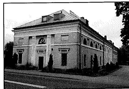
Kołaczkowo: Stajnia (ob. OWDiR)