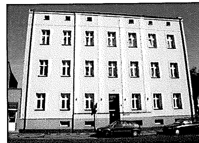
Września: Ośrodek zdrowia (ob. PINB, mieszkania) fol. S. Mazurkiewicz

Sposób użytkowania: biura - Powiatowy Inspektorat Nadzoru Budowlanego, mieszkania