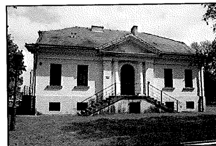
Kołaczkowo: Budynek dworski (obiekt nieużytkowany)

Sposób użytkowania: obiekt nieużytkowany