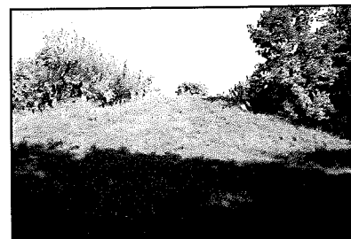
Zieliniec: Grodzisko fol. S. Mazurkiewicz