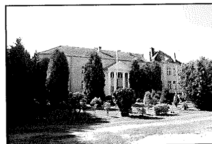
Zieliniec: Park krajobrazowy