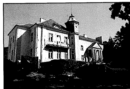
Zieliniec: Pałac (ob. Centrum Pomocy Bliźniemu)