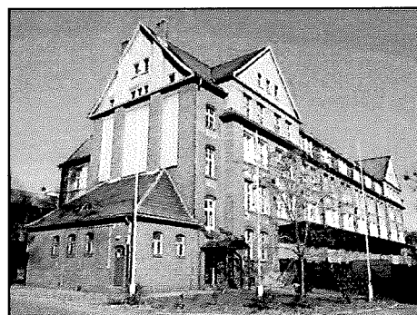
Września: Blok żołnierski w zespole koszar wojskowych (ob. obiekt nieużytkowany)

Sposób użytkowania: obiekt nieużytkowany, wystawiony na sprzedaż