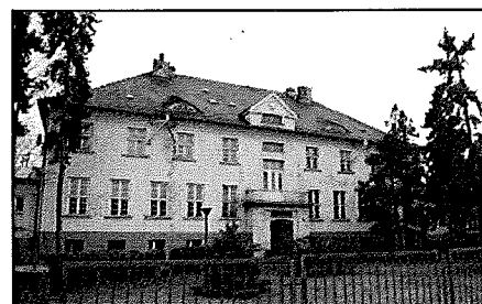
Września: Szkoła mleczarska (ob. częściowo mieszkania, częściowo nieużytkowany)

Sposób użytkowania: mieszkania, w większości obiekt nieużytkowany