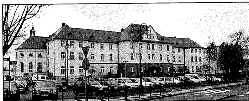
Września: Szpital powiatowy fol. S. Mazurkiewicz

Sposób użytkowania: szpital – Szpital Powiatowy we Wrześni Sp. z o.o.